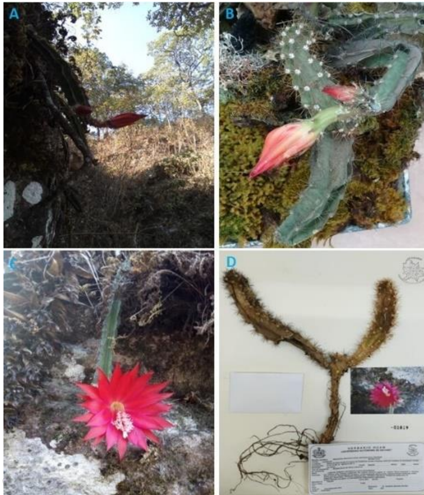
Figura 2. A).- Disocactus speciosus (Cav.) Barthlott subsp. speciosus habito péndulo y rupícola en su entorno natural. B).- Botón floral. C).- Flor en antesis. D).- Voucher.