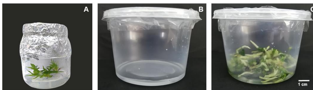
Figura 1. Propagación in vitro de Rhyncholaeliocattleya . A) Frascos de vidrio con medio de cultivo autoclavado, B) Recipientes plásticos con medio de cultivo no autoclavado, C) Recipientes plásticos utilizados en la micropropagación de Rlc.

Para la propagación (utilizando brotes individuales), no se observó contaminación en los contenedores desechables utilizando el método de autoclave y el método sin autoclave. En general, las variables evaluadas fueron mayores en el método sin autoclave que en el método con autoclave (Figura 1) (Tabla 1).