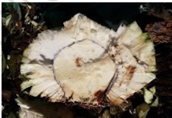
Figura 1. Imagen de la biomasa aprovechable o “piña”, que está conformada por el tallo y la base de las hojas de Agave maximiliana .

Para el estudio de la producción de biomasa aprovechable se consideró la “piña” que está conformada por el tallo y los segmentos basales de las hojas o pencas adheridos al mismo después de la jima o cosecha, (Figura 1) (Rendon-Salcido, 2007). Se pesaron en una báscula de piso con precisión de 0.5 g (marca Ohaus, modelo, Estados Unidos) cuatro individuos por cada uno de los ecotipos identificados a edades desde dos hasta ocho años reportándose el peso en kilogramos. Las plantas cosechadas se eligieron al azar en función de su fenotipo.