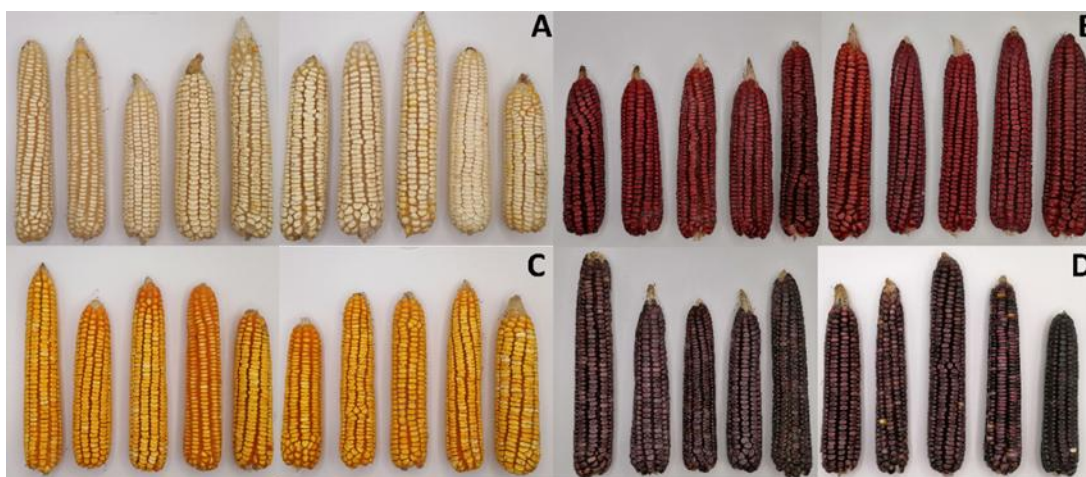
Figura 1. Mazorcas de la raza Tuxpeño recolectadas en la Huasteca Hidalguense, México. A) Variedad Blanco, B) Variedad Rojo, C) Variedad Amarillo y D) Variedad Morado.