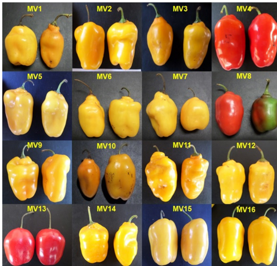
Figure 2. Manzano chili pepper landraces showing great morphological variability in some fruits.